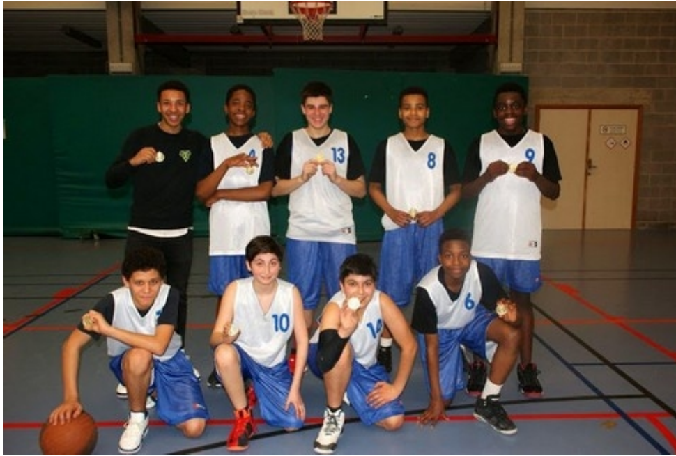
Equipe Minimes 2015-2016 de l'ISND avec leur médaille d'or du Brabant.

Les cadets n'ont, hélas, trouvé cette année qu'une seconde place avec des scores de matchs 32 à 05, 23 à 07, 32 à 23 pour finalement plier, après un dur combat, 20 à 27, face à une équipe plus nombreuse, plus grande, et fort bien entraînée. Un nouvel outsider pour les années futures...