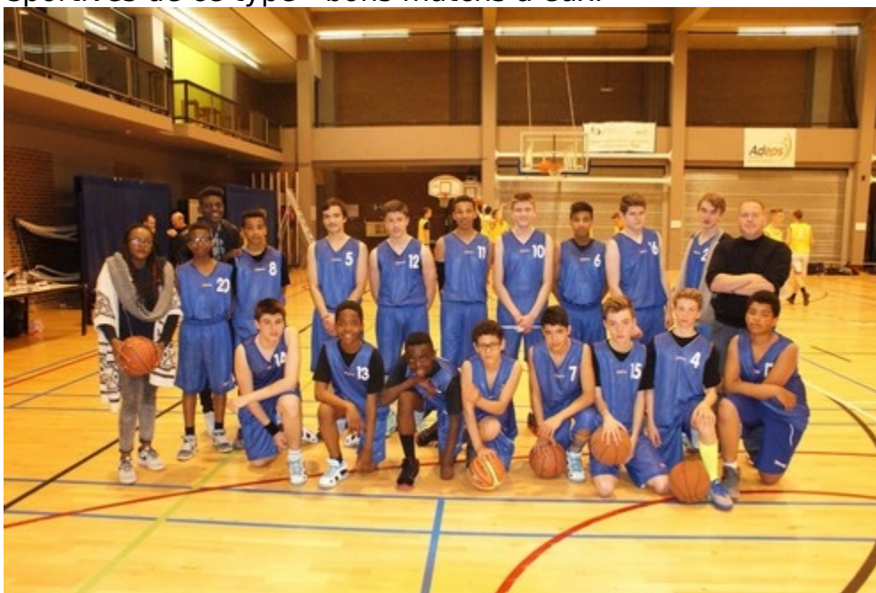
Les deux équipes (Minimes et Cadets) à la finale interprovinciale 2015 à Namur.

L'année passée, nous avons envoyé nos deux redoutables équipes en finale à Namur : un magnifique doublé provincial. Et si les Minimes ont obtenus la médaille de bronze, les Cadets ont remportés la finale face aux équipes d'écoles sportives (faisant près de 12h de basket par semaine) ; une performance inégalée depuis 2008... par nos Minimes de cette époque. Certains de ces étudiants nous ont d'ailleurs quittés pour des écoles sportives de ce type - bons matchs à eux.